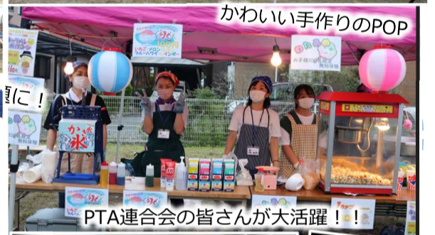
かわいい手作りのPOP