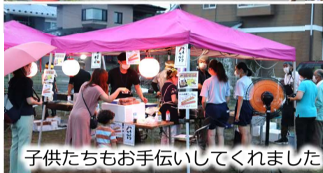
子供たちもお手伝いしてくれました