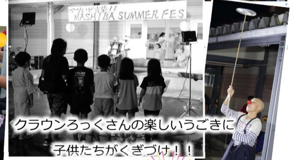
クラウンをつくさんの楽しいごき