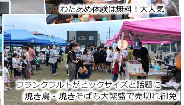
フランクフルトがビックサイズと話題に 焼き鳥・焼きそばも大繁盛で売切れ御免