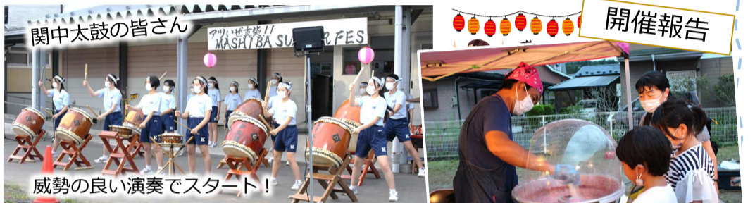
関中太鼓の皆さん

まち協で初の夏祭り!今年発足した真柴地区PTA連合会が地域の皆さんや子供たちの夏の思い出づくりにと、準備から当日の運営までを行い、大活躍してくれました。まち協役員スタッフと協力し予想をはるかに超えた400名超の来場でイベントは大盛況でした。