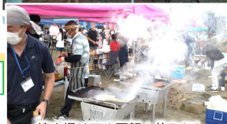
焼き場はフル回転!休みなし