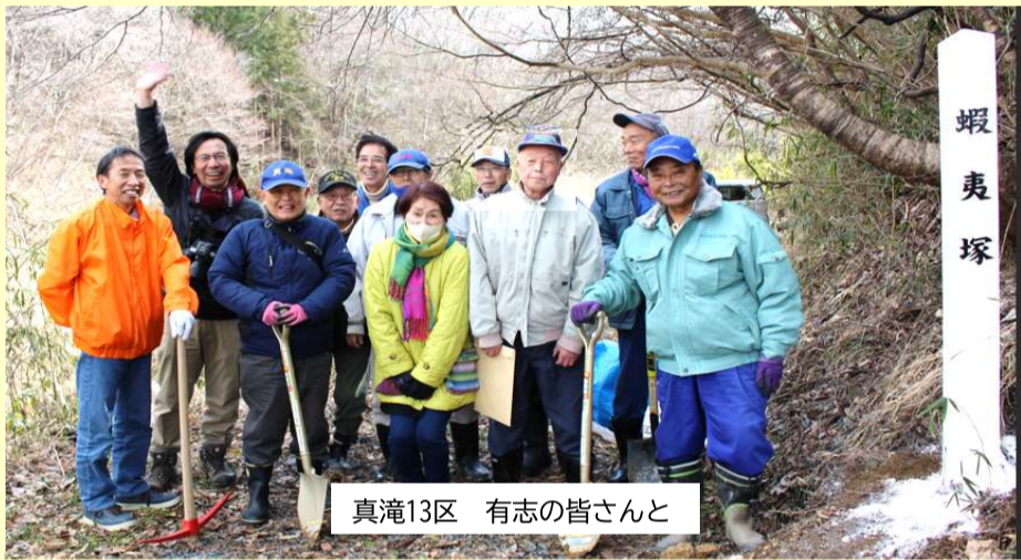
真滝13区 有志の皆さんと

蝦夷塚は、埋蔵文化財宝蔵地(遺跡コード OE16-1212)に指定されており、真柴地域に残る大変貴重な史跡となっています。