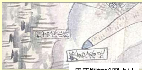
鬼死骸村絵図より