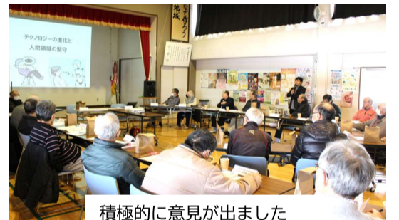
積極的に意見が出ました

様々な人の意見を出し合い、受け止め、今後も地域の話合いの場を大切にこの交流会を継続していきます。